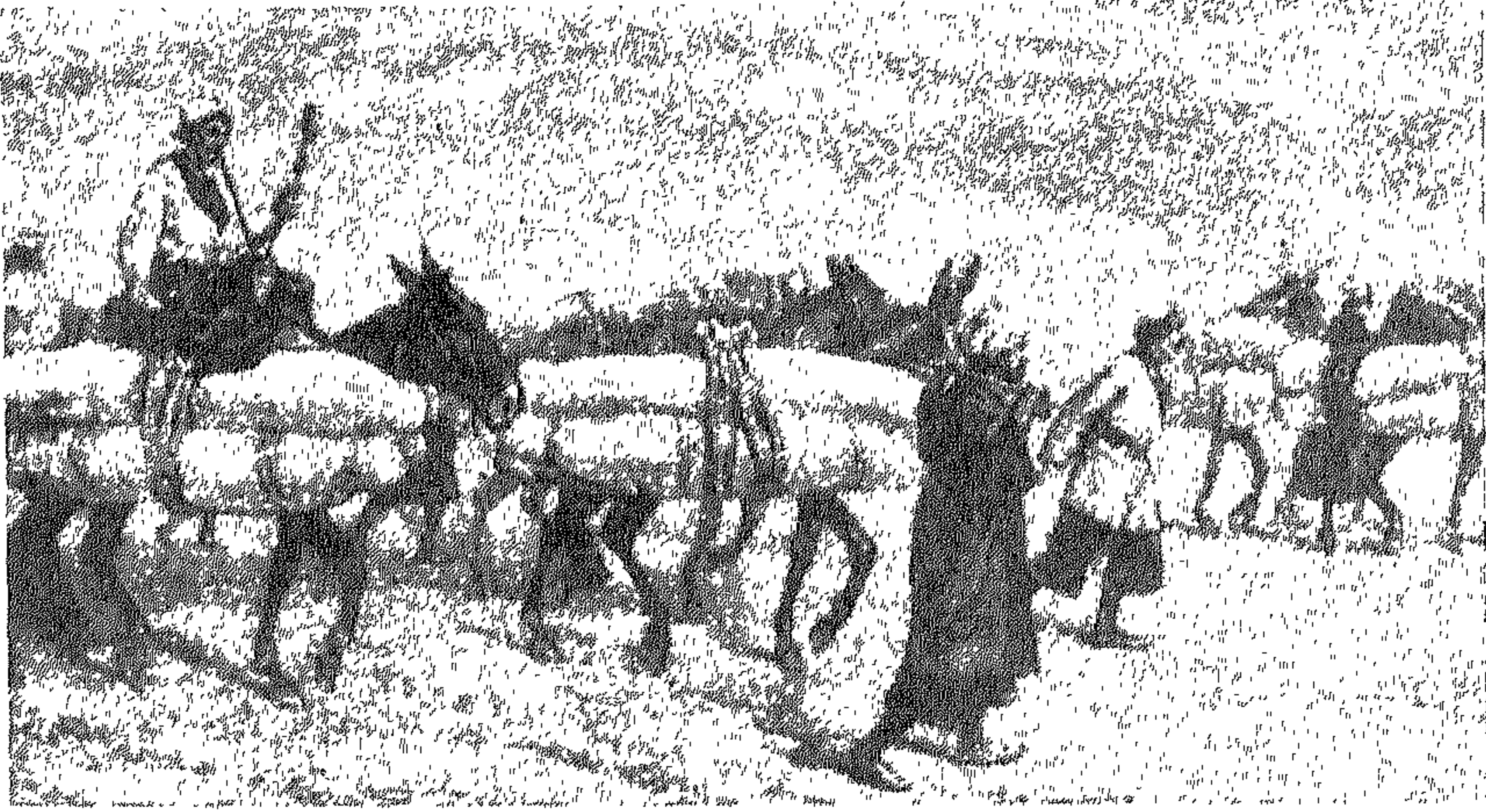
رحلة نقل الجناز إلى النجف لدفنها في وادي السلام.

تشغل المقابر في النجف أضعاف مساحة المدينة إذ أنها محاطة بالمدافن تقريباً من جميع الجهات إلا الجنوب الغربي حيث يقع منها «البحر» وهذه المدافن ترى للزائر كأنها مدينة قائمة في تلك الأرض ولكنها بالحقيقة مدينة الأموات لا مدينة الأحياء ففي هذه المدافن تقوم قبب وغرف مزخرفة وبعضها محاطة بجدران وكلها مبنية بناية متقنة جيدة بالحصص والآجر ولبعض هذه المدافن سراديب عميقة تحت الأرض ينزل إليها بسلام.